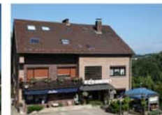
"Cafe Werner" Restaurant, Cafe Tel. 05234 2510 Ruhetag: Montag