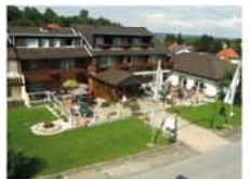
***Landhotel "Weber" Cafe Tel. 05234 84930 Ruhetag: Mittwoch