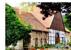
"Teutonenhof" Veranstaltungslokal Tel 05234 84080 Öffnung nach Vereinbarung