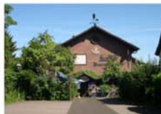
Gaststätte "Bauerstübchen" Restaurant, Cafe Tel.05234 5887 Ruhetag: Mittwoch